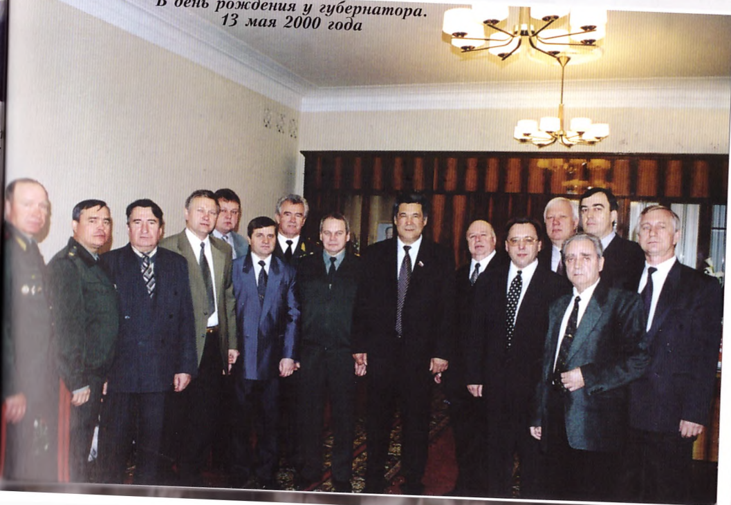
В день рождения у губернатора. 13 мая 2000 года