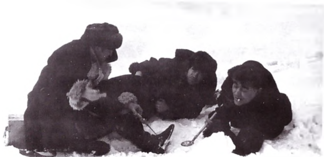
Зимняя рыбалка на Томи. 1983 год