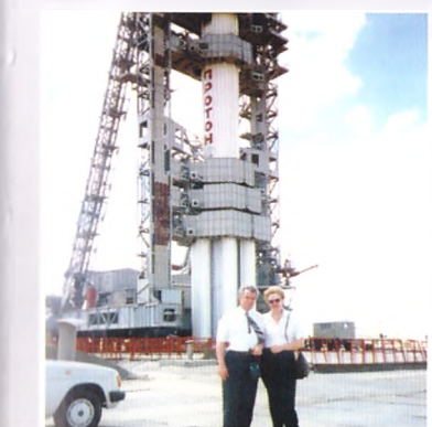
На космодроме «Байконур». 23 мая 1997 года