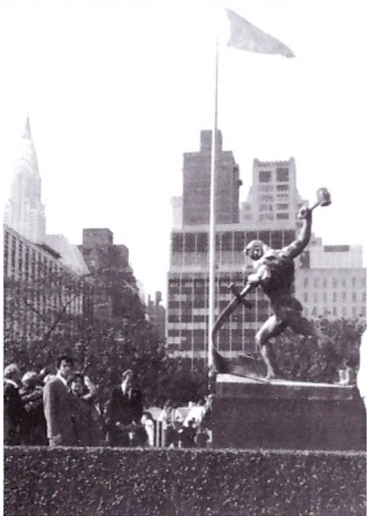
У здания ООН в Нью-Йорке. Октябрь 1979 года

Но пройдет совсем немного времени, и окажется, что все это были еще только цветочки и самое страшное — впереди.