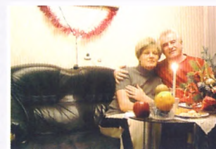
Рождество 2005 года. Белокуриха, санаторий «Родник Алтая»