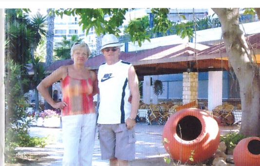
На Кипре, г. Пафос. Сентябрь 2006 г.