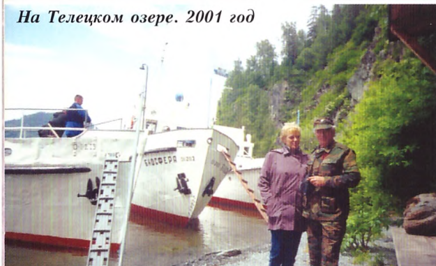
На Телецком озере. 2001 год