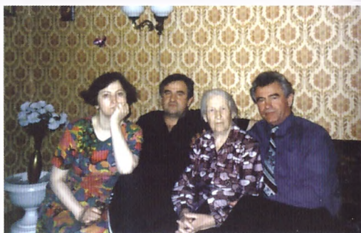
4 декабря 1997 года