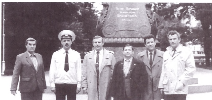
Всесоюзное совещание по борьбе с организованной преступностью (участники совещания от КГБ СССР). Кроштадт, 1990 год

Спасло положение как раз в этот момент полученная кемеровским Управлением КГБ из Москвы по ВЧ-связи информация, которую Кузнецов, выйдя на трибуну, тут же довел до сведения собравшихся: Б. Ельцин только что подписал указ, запрещающий забастовки. В подтверждение Анатолий Витальевич показал ксерокопию документа и от себя добавил, что точки зрения президента России и председателя Кемеровского областного Совета Тулеева в данном случае абсолютно совпадают.