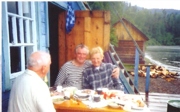
Хорошо после баньки отведать ухи! Телецкое озеро, 2001 год