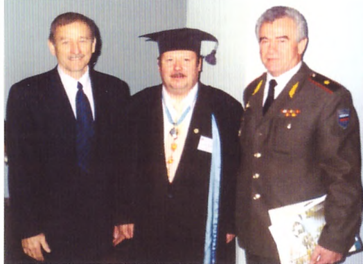
На 60-летию КузПИ