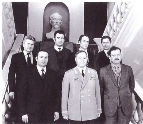
Начальство УКГБ СССР Кемеровской области. Генерал-майор М.А. Круглов с начальниками отделов управления.

года имела свои специфические особенности. Состав Совета был многообразен, пестр и противоречив подчас до полного антагонизма. Под одной крышей собрались и ярые коммунисты, и оголтелые «комитетчики» из рабочего движения, и бывшие диссиденты, известные, в том числе, и органам госбезопасности, и просто психически больные люди. Отражая те или иные собственные пристрастия, фракции вырабатывали тактику и стратегию предстоящих баталлий на заседаниях Совета. Шла непрерывная борьба за портфель в комитетах, по формированию структуры и персонального состава администрации. Нередко