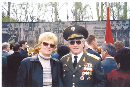
День Победы. Аллея Героев. г. Новокузнецк, 2007 год