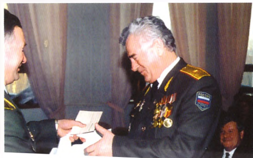
Начальник УФСБ генерал-майор В.В. Паччин. Вручение юбилейной книги «Чекисты Кузбасса»