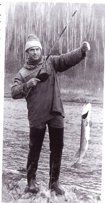
На рыбалке. Таймень весит 7 кг. Усть-Кабырза, река Мрассу, 1986 год

Центр тоже снесил. Был подготовлен «Закон об органах государственной безопасности СССР». Анатолию Витальевичу довелось присутствовать на заседании Верховного Совета СССР при его принятии.