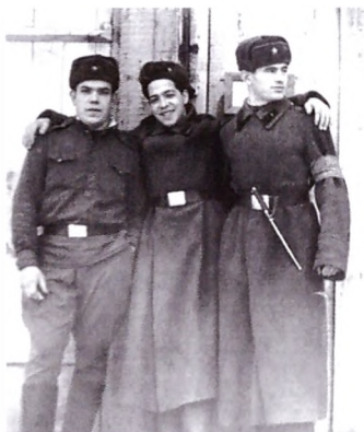
Красноярск, военная часть № 34651, 1962 год