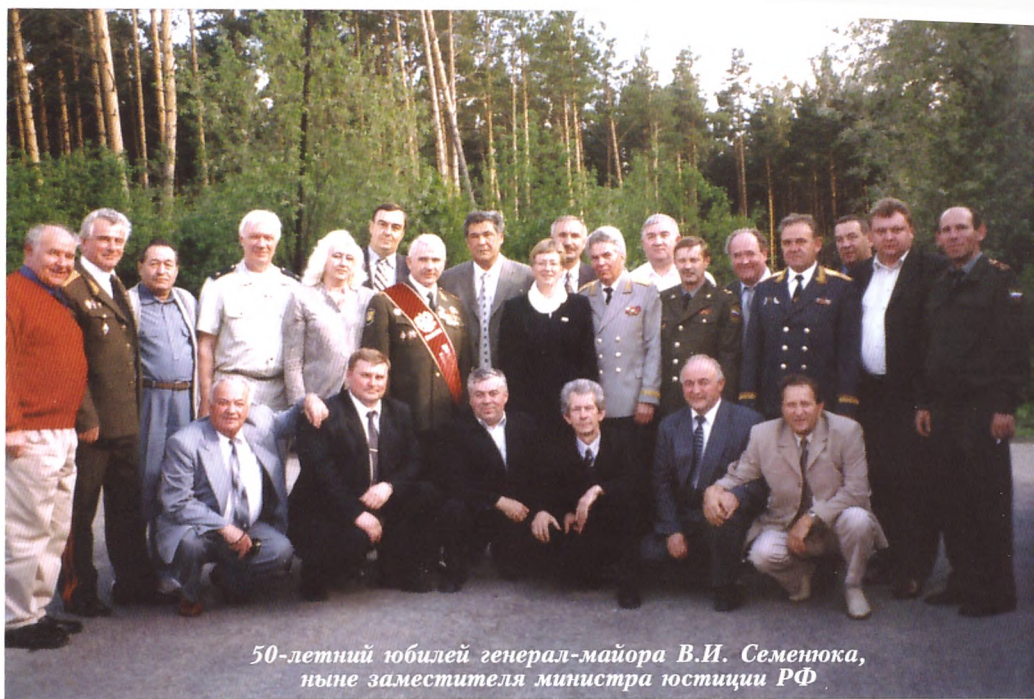
50-летний юбилей генерал-майора В.И. Семенова, ныне заместителя министра юстиции РФ