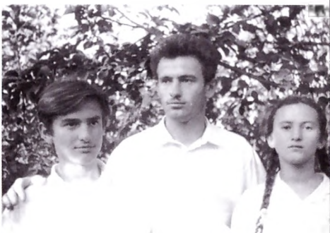
г. Осипки, 1963 год