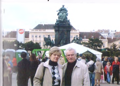
Австрия, Вена. Октябрь 2005 года