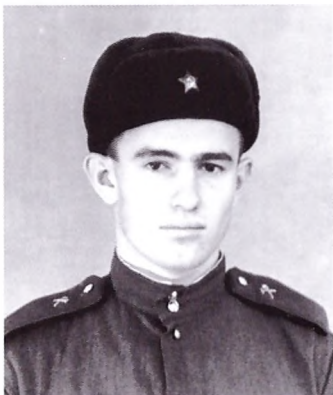
Красноярск, военная часть № 34651, 1960 год