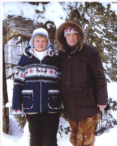
Усть-Кабырза, декабрь 2006 г.