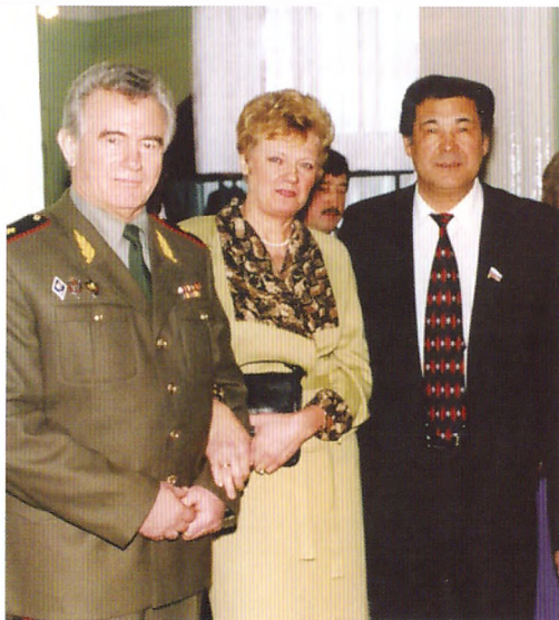
Губернатор А.Г. Тулеев с супругами Кузнецовыми

В ответ Кузнецов потребовал немедленно поставить в известность о готовящейся акции главу администрации и приостановить противоправные действия, сообщить также об этом прокурору области и начальнику УВД.