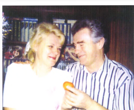
13 января 1995 года