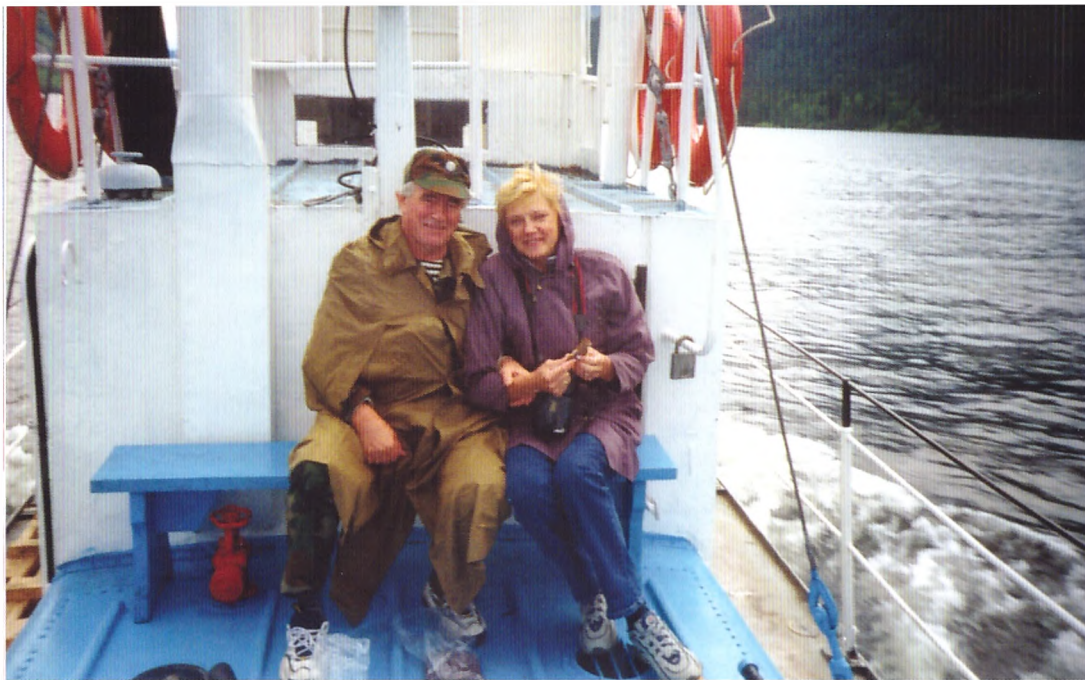
На Телецком озере. 2001 год