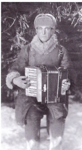
д. Молочино под Ржевом. 26 декабря 1942 года