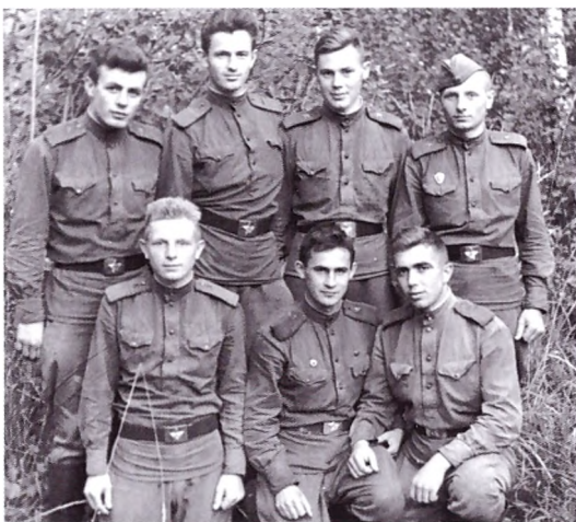
С земляками. Красноярск, военная часть № 34651, 18 июля 1961 года