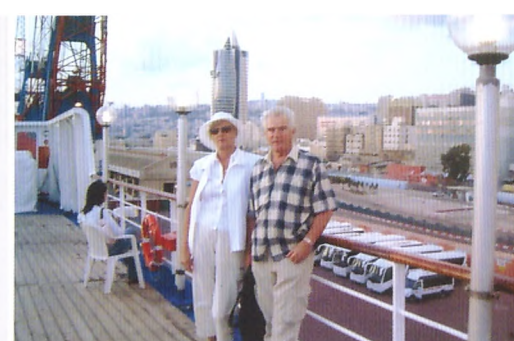
Израиль, порт Хайфа. Сентябрь 2007 г.