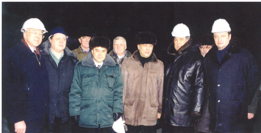
Будни Запсиба. 19 декабря 2000 года