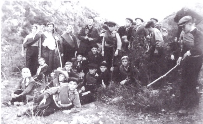
Поход в горы, г. Ленгер, 1954 год

В конце того же года, отслужив три года и один месяц, он демобилизовался.